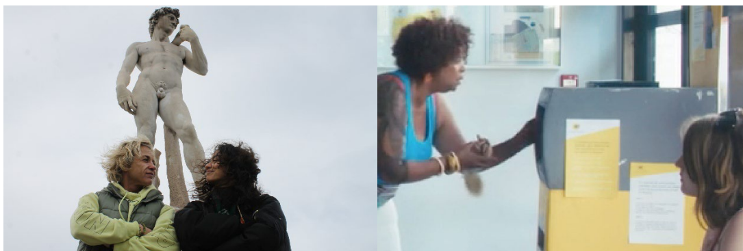
Claudia the Virgin, Zoé Lakhnati // La machine à affranchir, Nicole Genovese