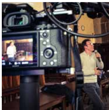
2017 : Michel Hazanavicius - Paris 9 e