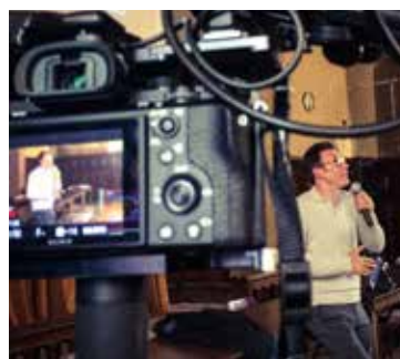
2017 : Michel Hazanavicius - Paris 9°