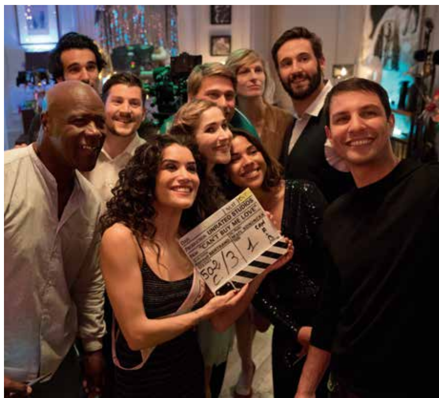
Tournage de la série Plan Cœur

Les auteurs français sont à l'origine d'histoires fantastiques, originales et qui plaisent au plus grand nombre. Nous sommes très enthousiastes au sujet des projets que nous avons aujourd'hui avec tous les auteurs que