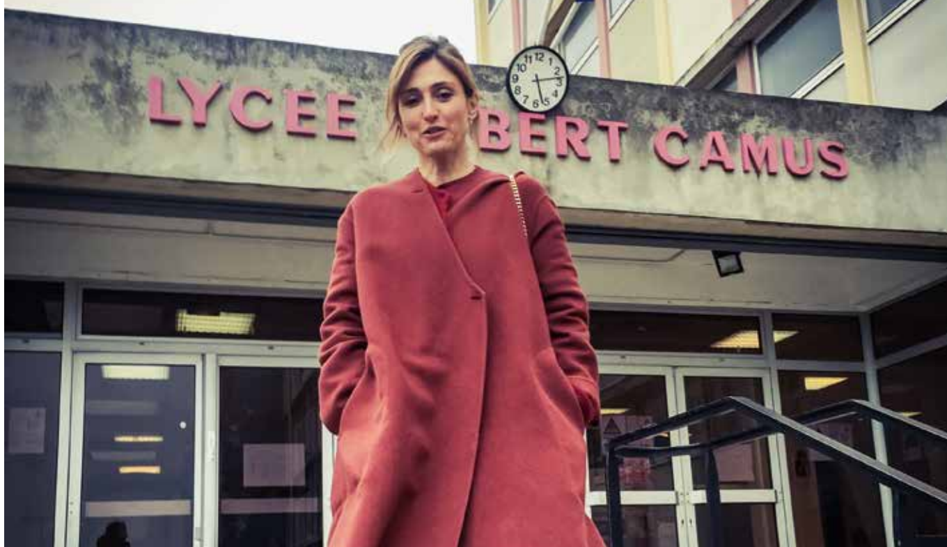
2018 : Julie Gayet - Bois Colombes (92)

“Il n’y a pas assez de rencontres de ce genre dans les écoles françaises... Très heureuse d’avoir été marraine ! Un Artiste à l’École c’est beaucoup d’émotion, de transmission et d’éducation.” Julie Gayet