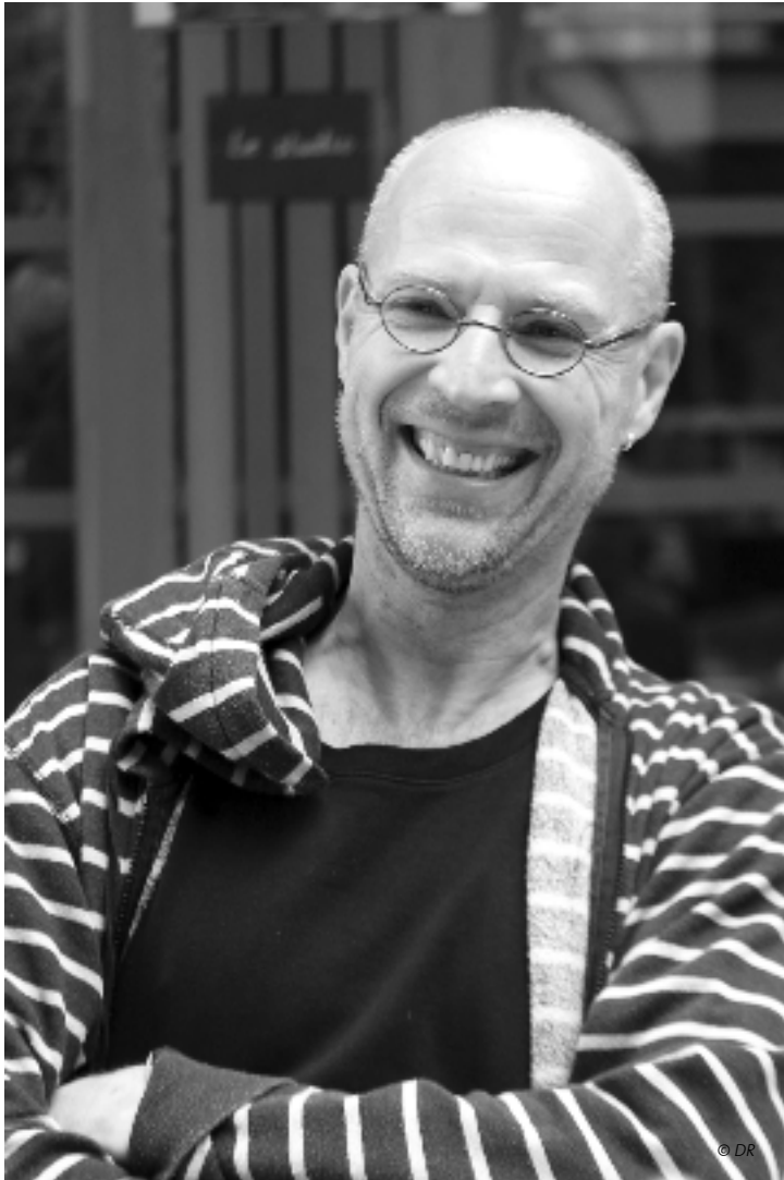
Prix Cirque Nikolaus Holz